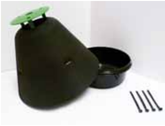
Code produit : 08007